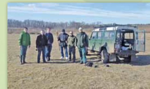
Kutató csapatunk a határ menti Lennhelyen.

A Zöld Körrel lebonyolított Interreg programok keretében felmértük Hajdú-Bihar és Bihar megyék határ menti védett és védendő területeit, védetté nyilvánításokat indítottunk el.