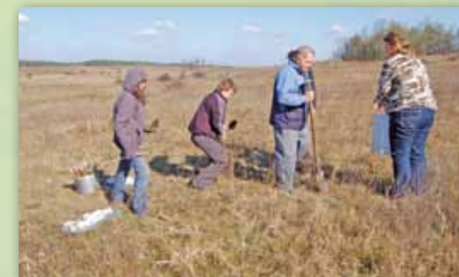
Védett növények visszatelepítése eredeti élőhelyükre önkéntesekkel.

Védett és veszélyeztetett növényfajok védelmére (szaporítás és mesterséges visszatelepítés) programot folytatunk a Debreceni Egyetem Botanikus kertjével közösen.