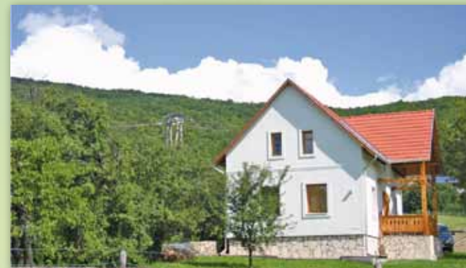
A Kisgyőri Természet Háza a Bükki Nemzeti Park mellett.

Kisgyőrben létrehoztuk a „Természet házát”, ahol előadásokat, szakköröket, nyári tábort szervezünk, és tanösvényekkel, természetbarát mintakerttel várjuk az érdeklődőket. Szintén részt veszünk a Debrecen-Háromhegyi Természet Háza működtetésében.