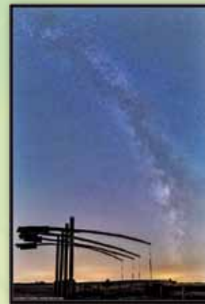
a csillagfényes Hortobágyon.

Csillagászati programjainkban a „Magnitúdó Csillagászati Egyesület Debrecen”-nel folytatunk együttműködést.