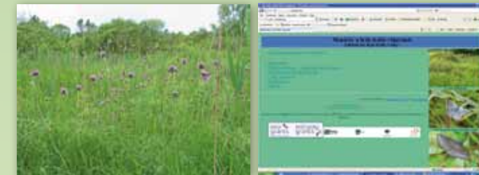
A Daru-láp, és Kék-Kálló programunk honlapja ( http://kekkallo.csillagpark.hu/ )

A Kék-Kálló völgyében (Bagamér-Álmosd-Létavértes) földterületeket bérlünk és vásároltunk, itt természetvédelmi kezelést, rekonstrukciós programokat folytatunk.