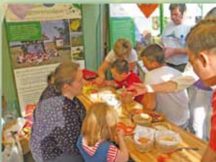
Kézműves program fenntarthatósági kampányunk részeként a Nagyerdei Kulturparkban.

Programjainkat a Varázsfa Alkotóműhellyel együttműködve valósítjuk meg.