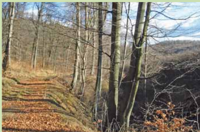
A Remete völgy Kisgyőr mellett.

Fő partnereink: a Magyar Természetvédők Szövetsége és a hajdúböszörményi Zöld Kör.