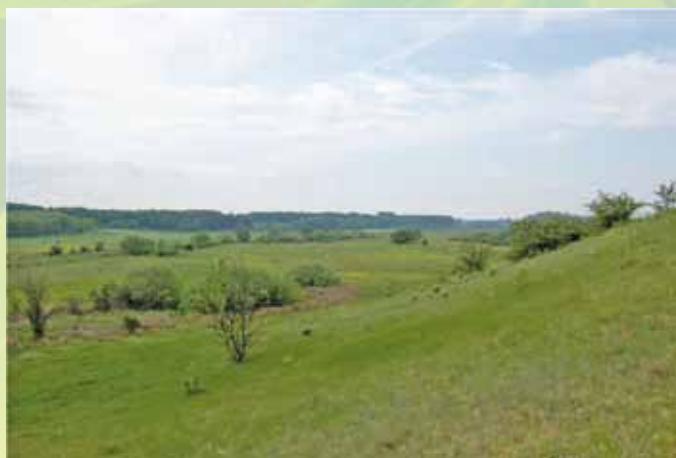
A Kék-Kálló völgy Bagamérnál