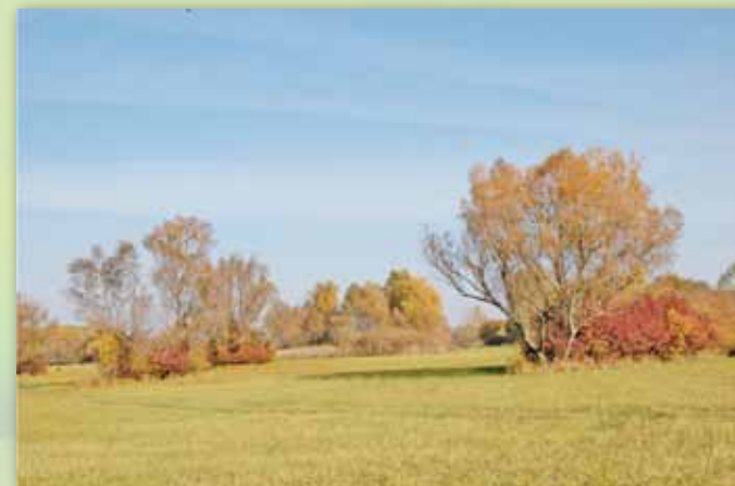
A létavértesi Falu-rét

„Land trust” programunk keretében a Bihar és Tiszatáj Közalapítvánnyal karöltve holland segítséggel (ECONET Action Fund) lápréteket és szikes tavakat vásároltunk meg (kb. 100 ha területen).