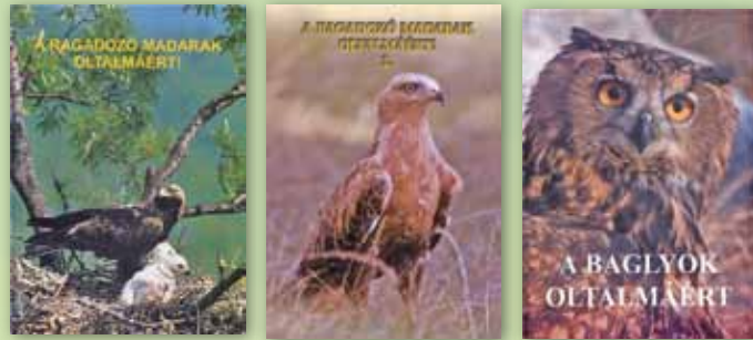
A ragadozó madarak védelmét népszerűsítő füzetek

Ragadozó-madár védelmi tevékenységeink között felvilágosító-kampányt folytatunk, mesterséges fészkeket építünk, téli etetést végzünk, és elindítottuk a keselyű Kárpát-medencei visszatelepítésére irányuló programunkat.