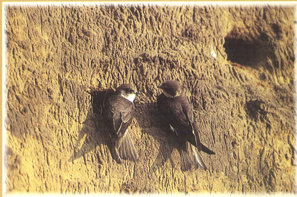
Parti fecskék fészükénél