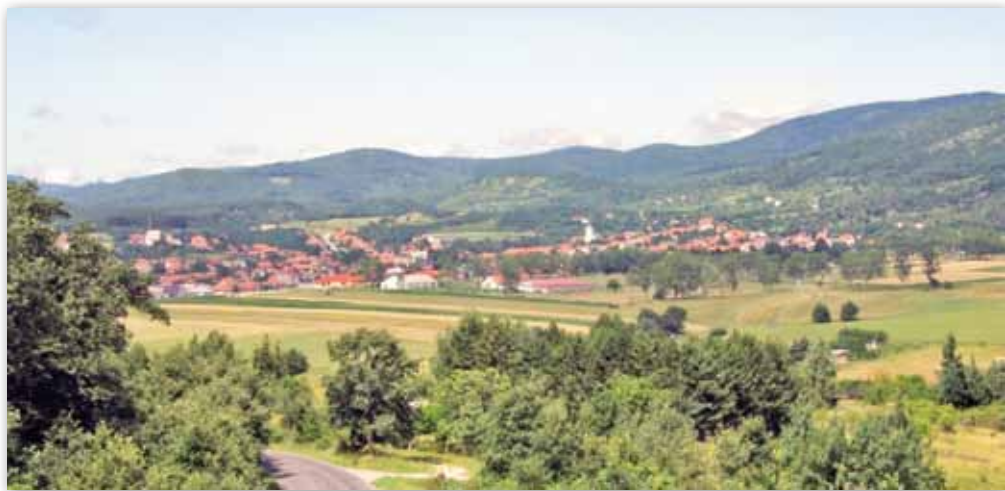
A település a Bükk ölelésében

Kisgyőr a Déli-Bükk kiemelkedő szépségű és igen változatos élővilágú táján terül el. A település fontos értéke, hogy környezetének természeti gazdagságát a Bükki Nemzeti Park és az Európai Unió természetvédelmi hálózatába tartozó NATURA 2000 területek is óvják. Ismerjük meg az alábbiakban ezeket az értékeket!