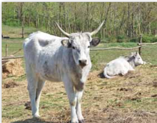
A falu határában pihenő szürkemarák