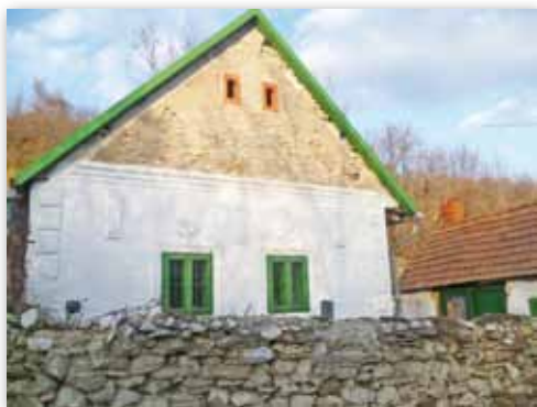
Szépén felújított szabadkéményes régi ház, és hagyományos porta szárazon rakott kerítéssel