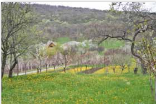
Gyümölcsös kert a Galya oldalában

filoxéra által okozott szőlőpusztulás jelentős lendületet adott a gyümölcsstermesztésnek. A bükkaljai gyümölcskultúrát a régiségben megközelítően negyven gyümölcsfajta gazdagította. A szilva, a körte, a meggy, az alma és a szőlősorok közé ültetett paraszbaracknak nevezett őszibarack mellett a cseresznyetermesztésnek volt (és van) nagy hagyománya.