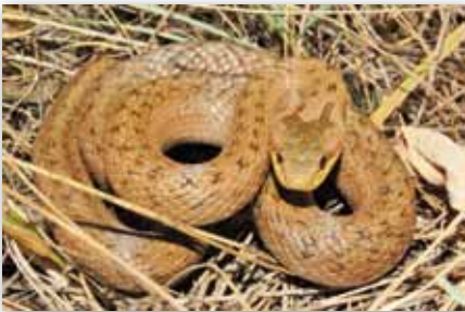
A rézsíklóval ritkán találkozunk

A melegkedvelő társulásokat cseres-tölgyesek övezik. A térség háborítatlan erdei ritka ragadozómadarak költőhelyeit rejt: parlagi sas, békászósas, darázsölyv, egerészölyv, karvaly. Ezek mellett megtalálható itt a császármadár, a holló, a fekete harkály és a szürke küllő is. A bükkre jellemző nagyvadak és ragadozók mellett említést érdemel a fel-felbukkanó hiúz és a vadmacska.