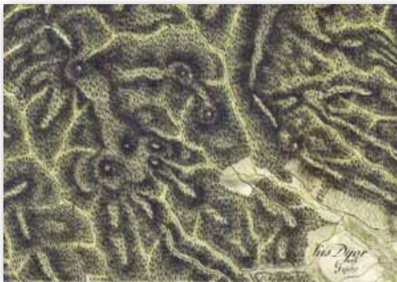
Kisgyőr az első katonai felmérés térképén (1780)

A településtől északra elterülő mészkőhátság karsztjelenségei a Bükk-fennsík bérceit idézik. A Nagy-bodzás, a Bükkös-Mátra, a Kőlyuk-galya tetőin tekintélyes méretű függőtöbrök sorjáznak, melyek átmérője gyakran a száz métert is eléri. Az Ásottfa-tető és a Galya-tető rétegfőkön kialakult terjedelmes karrmezői („ördögszántások”) szintén a fennsíkiakkal vetekszenek. A Kisgyőr–Tapolcai mészkőhátság területét töbör soros völgyek jellemzik, melyek a Nagy-fennsíkra emlékeztető bércek (Galuzsnya-tető, Nagy-Som-tető, a „kisgyőri Galyák” stb.) közé mélyülnek.