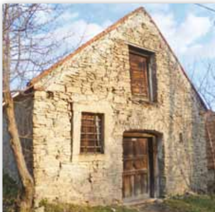
Tufába vajt és szárazon rakott falú borospince