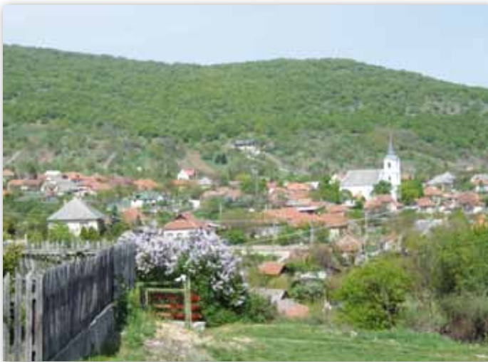
A község látképe az Elő-Galya szoknyáján húzódó szőlőskertekkel és a református templommal