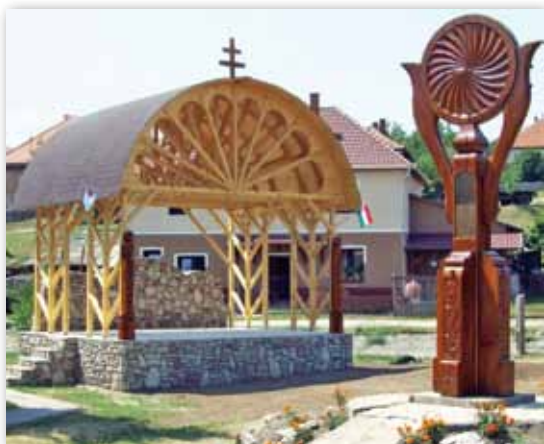
Az új színpad, és a „Falufa”

Kisgyőrben pezsgő kulturális élet zajlik. A rendezvények szervezése mellett több évtizede nagy hangsúlyt fektetnek az értékkeremtő kiscsoportos műhelymunkára. A Faluház intézménykomplexumban színházterem, könyvtár, teleház, klubhelyiség, szálláshely lett kialakítva, ahol egész évben gazdag programkínálattal és szolgáltatással várja a látogatók széles korosztályát. Civil szervezetek, kisközösségek bázishelye. Nemrég bővült a falu értékeinek sora az alábbi képeken látható „csűr-nyitott műhellyel” és benne helytörténeti gyűjteménnyel.