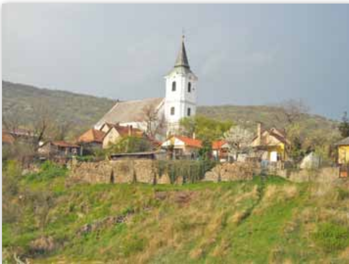
A Mária Terézia idején épült református templom a falu egyik ékessége

Utóbbi miatt nem véletlenül illetik a „faragott falu” jelzővel, hiszen már a rovásírásos helységnevével a tábla előtt egy impozáns Falukapun keresztül érkezünk meg, mely formájával emléket állít a hét vezérnek, miközben jobbról és balról a hagyományos kisgyőri kapufélfá öleli közre.