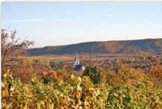
A falu a szőlőskertek felől

A térség éghajlata mérsékelten meleg és mérsékelten száraz, kevésbé hideg télű, a napsütés évi mértéke megközelíti az 1850 órát, az évi középhőmérséklet 9–10 °C körül alakul. Sokévi átlagban több mint 600 mm csapadék hull a területre. A Kisgyőri-medence mediterrán színezetű mikroklímája – a közettani és talajtani adottságok mellett – kedvez a kert- és a szőlőkultúra kialakulásának, a jó borok termelésének.