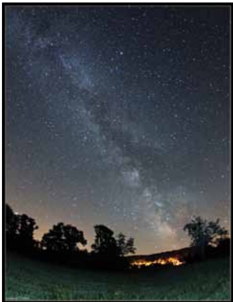
A falu felett látszik a Tejút

Az éjszakai természetes tájkép, a zavaró fényektől mentes csillagos égbolt is a Nemzeti Park védendő értékeinek része, és jó adottságai miatt Zselicet, Hortobágyot és Aggteleket követve a Bükk Nemzeti Park is „Csillagoségbolt-park” lehet. A felesleges, túlzott és rosszul irányított - a horizont síkja fölé vetülő- világítás ezt az értéket veszélyezteti, kárára van nemcsak az élővilágnak, de közös kulturális örökségünkkel - a csillagos égbolttal- való kapcsolatunkat is ellehetetleníti. Kisgyőr, akár a többi bükk település sokat tehet azért, hogy a Nemzeti Park és környezete éjjel is a háborítatlan természet jelképe maradjon.